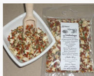
Jamalaya Gewürzmischung ohne Glutamat / 50 g 1.30EUR